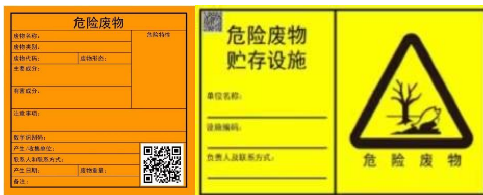
图4-1 危险废物样式标签示意图

采取上述管理措施后，建设项目固体废物可得到妥善储存、合理利用、及时处理，对周围环境影响可接受。